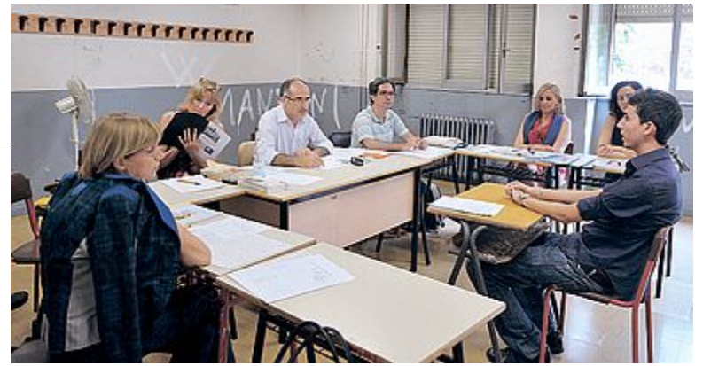
VERIFICA Uno studente attorniato dai professori della commissione

alla fine si scioglie in gioia: «Siamo liberi!»